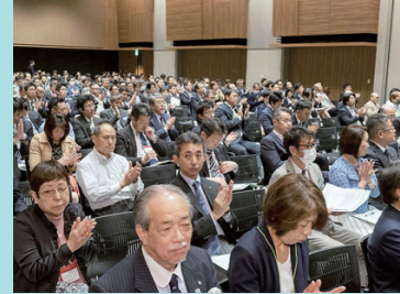
拍手をもって承認