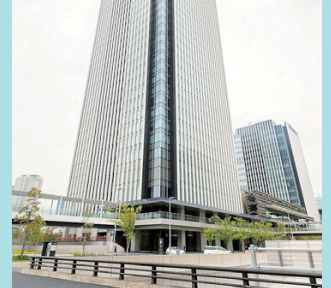
会場となった名古屋コンベンションホール