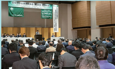
総会議事で活動経過、方針等を確認