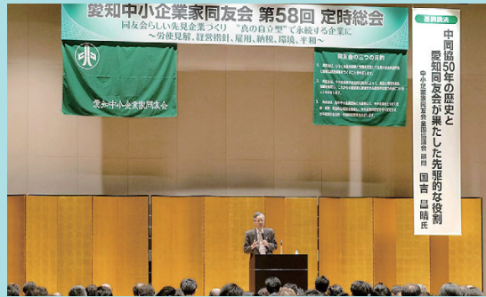
基調講演で同友会の歴史を深める