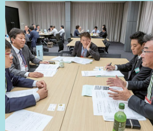
分散会では基調講演を受けて学びを深める