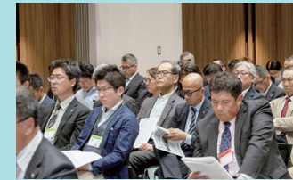
国吉氏の報告を熱心に聞く