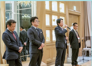
新支部長の4名より抱負が語られた