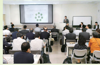
中小企業憲章草案とSDGsの親和性を学ぶ