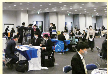
計5日間開催し、 のべ362名の学生が来場