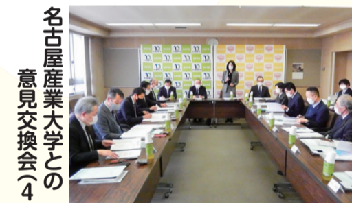
名古屋産業大学との 意見交換会(4/28)