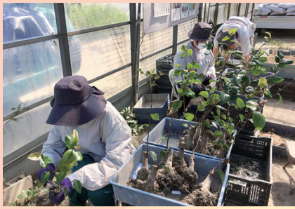
インターンシップ(8/23～9/3) 学生69名が31社と愛知同友会事務局で2週間の研修を行った (写真は企業での研修の様子)

～写真で見る愛知同友会 「同友Aichi」で紹介された写真を 中心に昨年の活動を振り返ります。 (広報部)