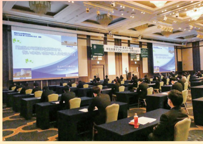
合同入社式(4/1) 2年ぶりに開催。59社から 138名の新入社員が参加