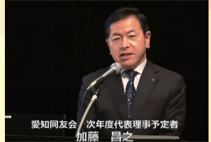
方針学習会(2/1) コロナ禍で激変した2020 年度を振り返り、次年度 の方針を深める