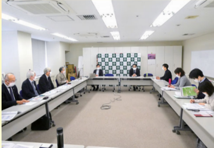
報道記者との 情報交換会(4/8) 2月末景況調査と賃金・労働 実態調査の結果を伝える