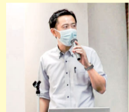
地区例会 全65地区が会員の実践報告を中心に学び合う