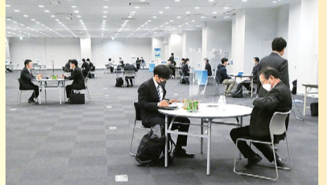
17社が出展し、20名以上 の学生が来場。就職活動 の解禁前に、学生と企業 の交流の場を持つ