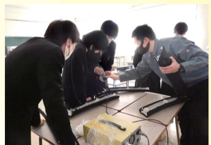
一宮起工科高校 企業展(3/15) 一・二年の生徒が地元の中 小企業の仕事を実際に体験