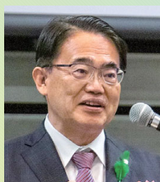
来賓の大村秀章 愛知県知事