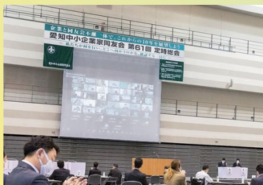
総会当日 300 名がオンライン参加