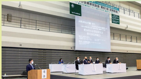
壇上に控える代表役員の皆さん