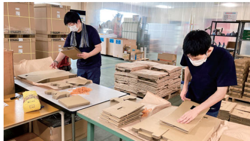
商品の梱包 (トヨコン)