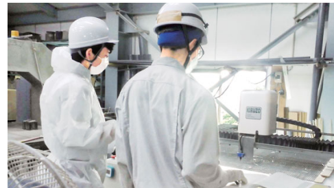
機械の動作確認 (今村工業)