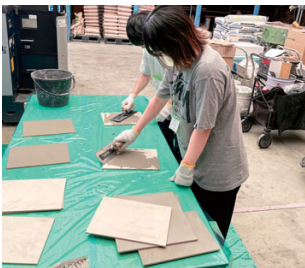
左官材鍍塗り体験(牧ヶ野業務店)