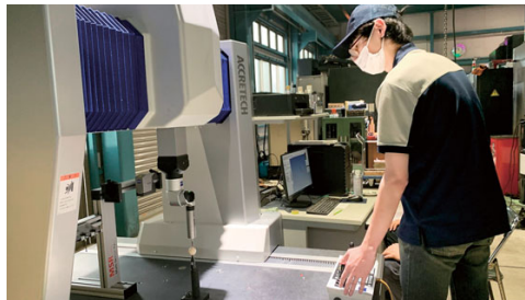
測定器による検査 (近藤工作所)