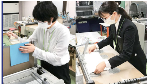
製本の作業 (三恵社)