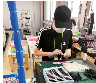
商品の検品作業(鳥越樹脂工業)