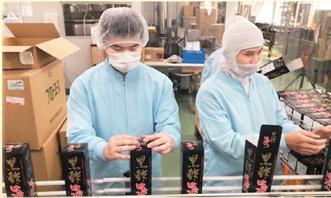
企業と学校との 就職懇談会(9/22) 会員企業28社と大学27校より総勢67名が参加。「若者を地域に残し育てていく」を共通認識に。