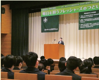
合同入社式(4/1)、 新入社員共育研修会(4/2) 入社式に64社から128名、研修会に55社から109名の新入社員が参加。社会人としての決意を固める。