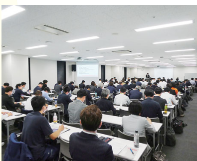
正副地区会長研修会 (5/29) 106名が参加。同友会理念の理解を深め、自社での実践を通して地区の活性化実現をめざす。