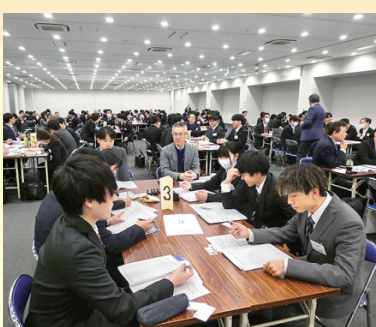
第64回定時総会(4/25) 336名が参加し、「労使見解」を主題とした全体課題提起を踏まえ、3つの分散会で討議。