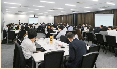
入社2年目ステップ アップ共育研修会 (6/27) 37社から71名の「同期社員」が参加。基本を大切にしながら挑戦していく決意を新たにする。