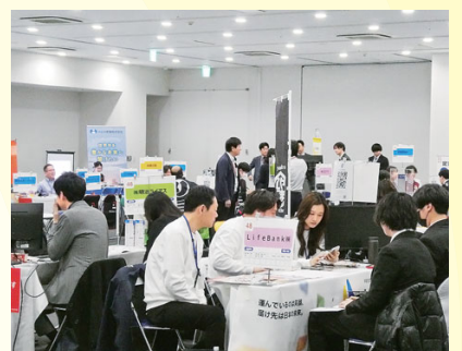
合同企業説明会 (3/12・13) 学生の就職先選択肢となるべく、地域で頑張っている中小企業の存在を伝える。