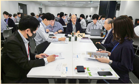
企業研究成果発表会 (10/16) 今年度のインターンシップ参加学生・企業・大学等から50名が参加。学生3チームが研修の成果を発表。