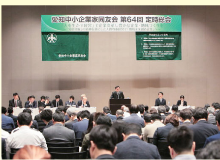
正副地区会長研修会 (5/29) 106名が参加。同友会理念の理解を深め、自社での実践を通して地区の活性化実現をめざす。