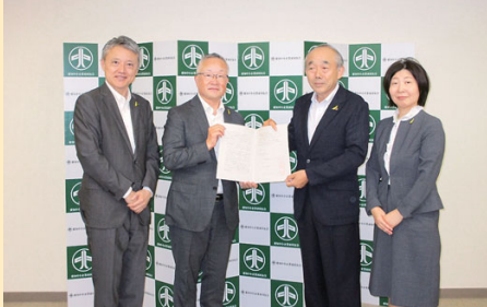
愛知労働局と県より 協力雇用主登録拡大に 向けた要請(7/18) 再犯防止、社会復帰の力となる安定就労登録の呼びかけを受け、協力していくことを確認。