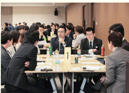
正副地区会長研修会 (5/29) 106名が参加。同友会理念の理解を深め、自社での実践を通して地区の活性化実現をめざす。