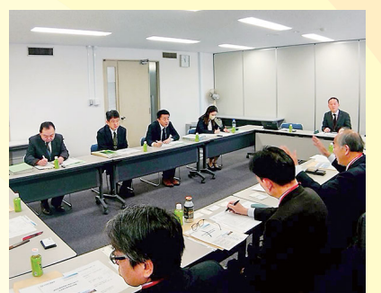
公正取引委員会との 意見交換会(3/7) 物価高騰と価格転嫁問題で意見交換し、すべての企業が社会的責任を果たしていくべきことを確認。