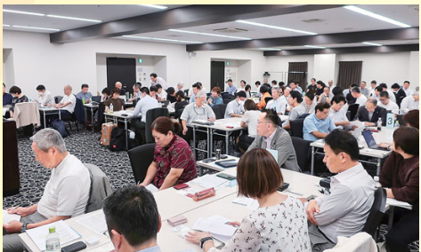
中同協共同求人・社員 教育合同委員会 愛知 開催(9/11・12) 33同友会と中同協より90名が参加。中小企業の魅力発信の先頭に立っていくことを確認。