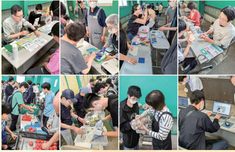
バリアフリー交流会 in南尾張(6/14) 総勢200名超が参加。さまざまな仕事体験や交流を通して、障害のある人との関わりを広げる。