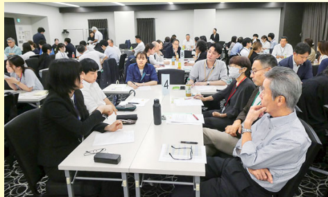
大学生インターンシップ (8/18・9/12) 会員企業28社で大学生28名が延べ2週間の研修を実施。(上)修了式での討論の様子、下/企業での実習の様子。