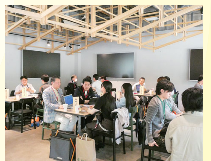
「カフェで就活」 (5/13・16・20) 久屋大通公園のカフェにてカジュアルな雰囲気での企業説明会を実施。延べ101名の学生が来場。